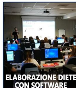
ELABORAZIONE DIETE CON SOFTWARE