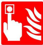
PULSANTE DI ALLARME