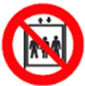
NON ADOPERARE GLI ASCENSORI IN CASO DI INCENDIO