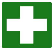
CASSETTA DI PRIMO SOCCORSO