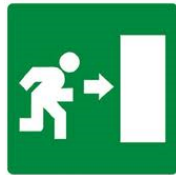
USCITA DI EMERGENZA