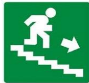
SCALA DI EMERGENZA