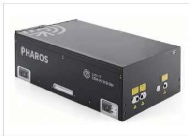
PHAROS-PH2 femtosecond laser

In rosso tutte le specifiche tecniche che sono migliorative rispetto ai valori minimi richiesti sul capitolato tecnico o addizionali. Costituiscono ulteriori caratteristiche migliorative addizionali la doppia modalità operativa del sistema, illustrata nel successivo paragrafo "CONFIGURAZIONE FINALE", e l'estensione di garanzia sull'intero sistema a 24 (ventiquattro) mesi.