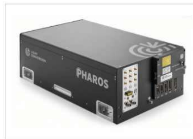
PHAROS-PH2 femtosecond laser (back view)