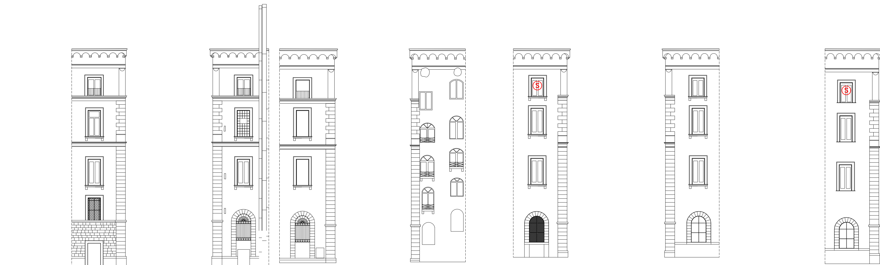
PROSPETTI LATERALI SU VICO SAN MARCELLINO 1:200