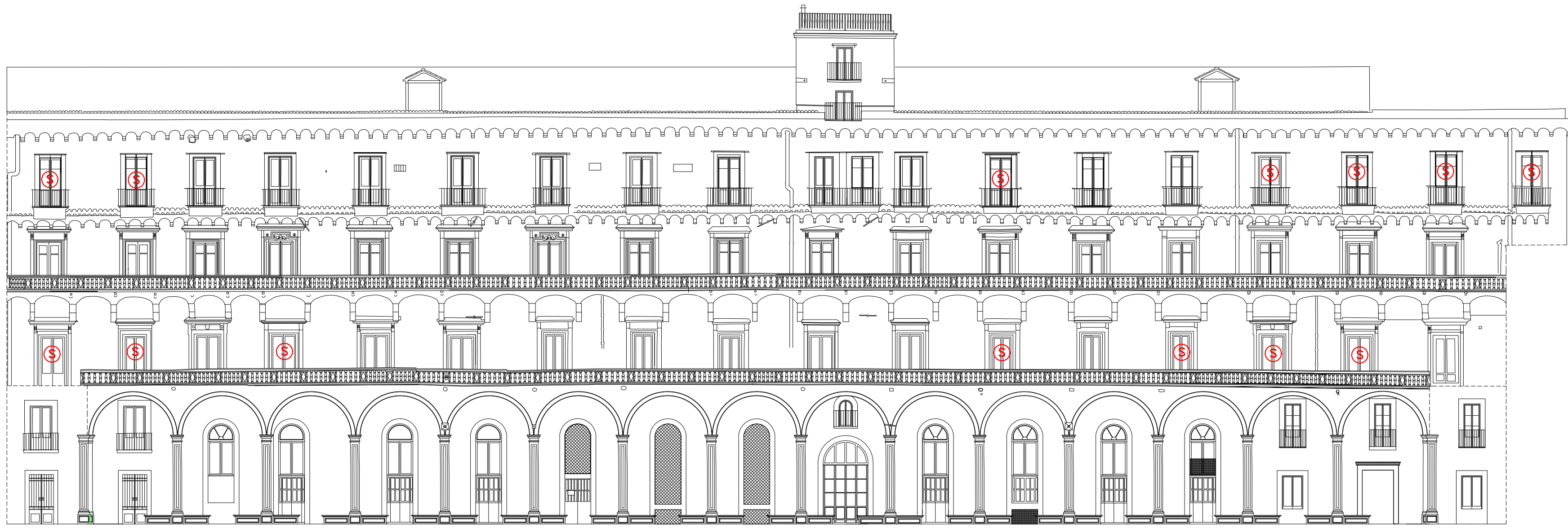
INFISSI DA SOSTITUIRE