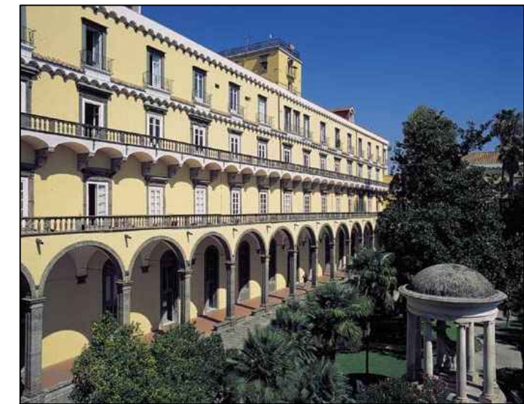
SMARC.1856L Complesso di San Marcellino

università degli studi di napoli federico II ripartizione edilizia