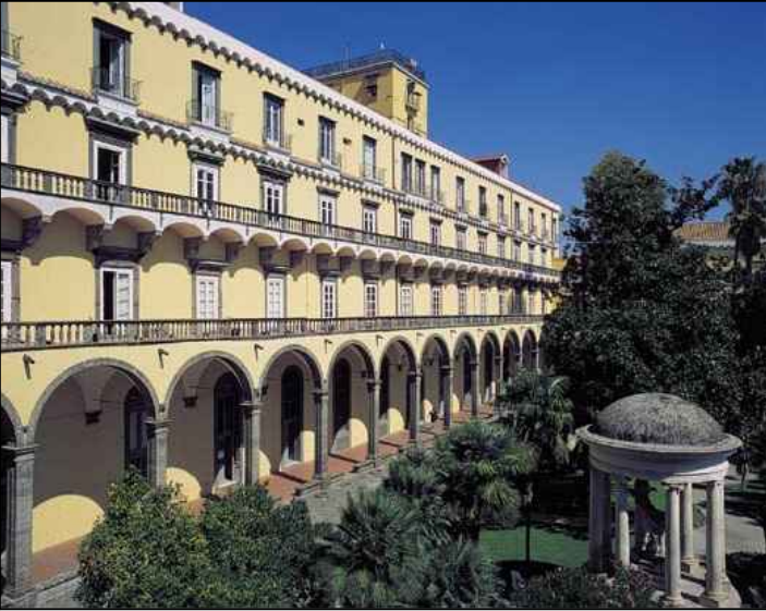
SMARC.1856L Complesso di San Marcellino

Lavori di manutenzione degli ambienti di San Marcellino lasciati liberi dal Dipartimento di Scienze della Terra per le nuove esigenze dei Dipartimenti di Sociologia e Scienze Politiche